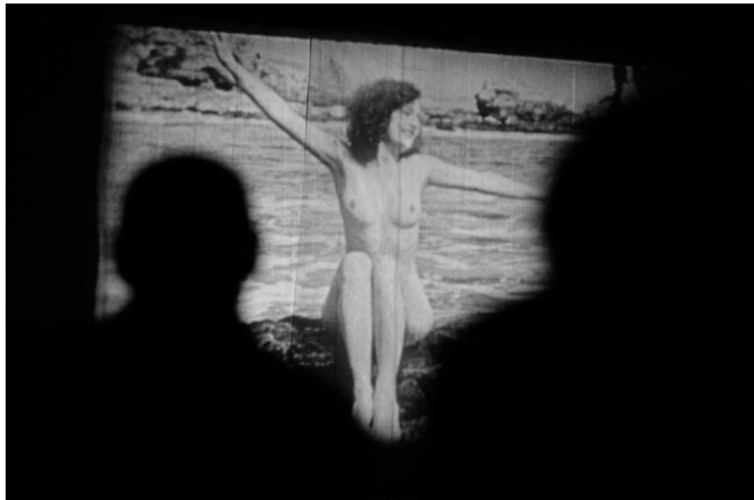
Stehno přeci jen bude...

Letos festivalu přibyla zajímavá akce pro fajnšmekry. Na letní scéně Pod Chebským mostem se poprvé objevuje promítání starých filmů na šestnáctimilimetrových páscech. Projekt Kino 16 míří především do srdcí staromilců a obdivovatelů retro atmosféry.