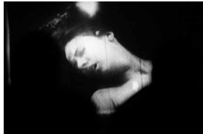
Ne, toto není scéna vraždy...

Nová atrakce pro festivalové návštěvníky si teprve buduje místo v programu, už teď má ale